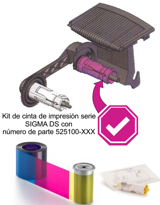
Kit de cinta de impresión serie SIGMA DS con número de parte 525100-XXX