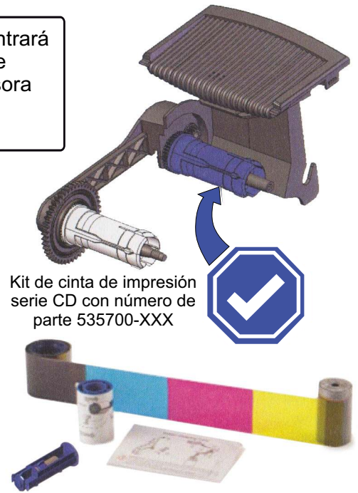
Kit de cinta de impresión serie CD con número de parte 535700-XXX

©2021 Entrust Corporation. All rights reserved.